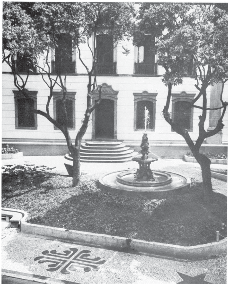
A obra mais recente da administração da Venerável Ordem Terceira dos Mínimos de São Francisco de Paula é o embelezamento da parte posterior do templo, com o ajardinamento do local, que tomou o nome de Adro Cardeal Jaime Câmara, e a aquisição e instalação de um chafariz luminoso do estilo veneziano.