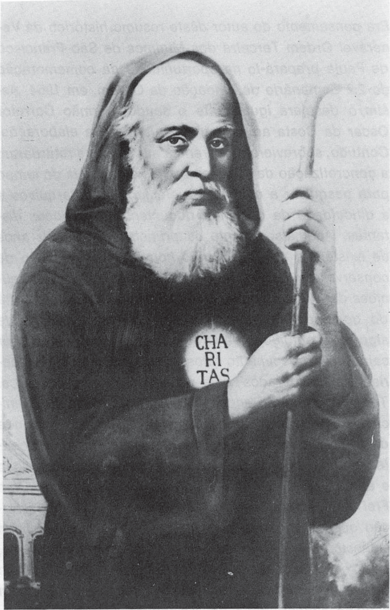
São Francisco de Paula, Patrono da VOTMSFP, fundou no Século XV a Ordem dos Mínimos. Morreu em Plessis-les-Tours a 2 de abril de 1507 e foi canonizado por Leão X, 1519.