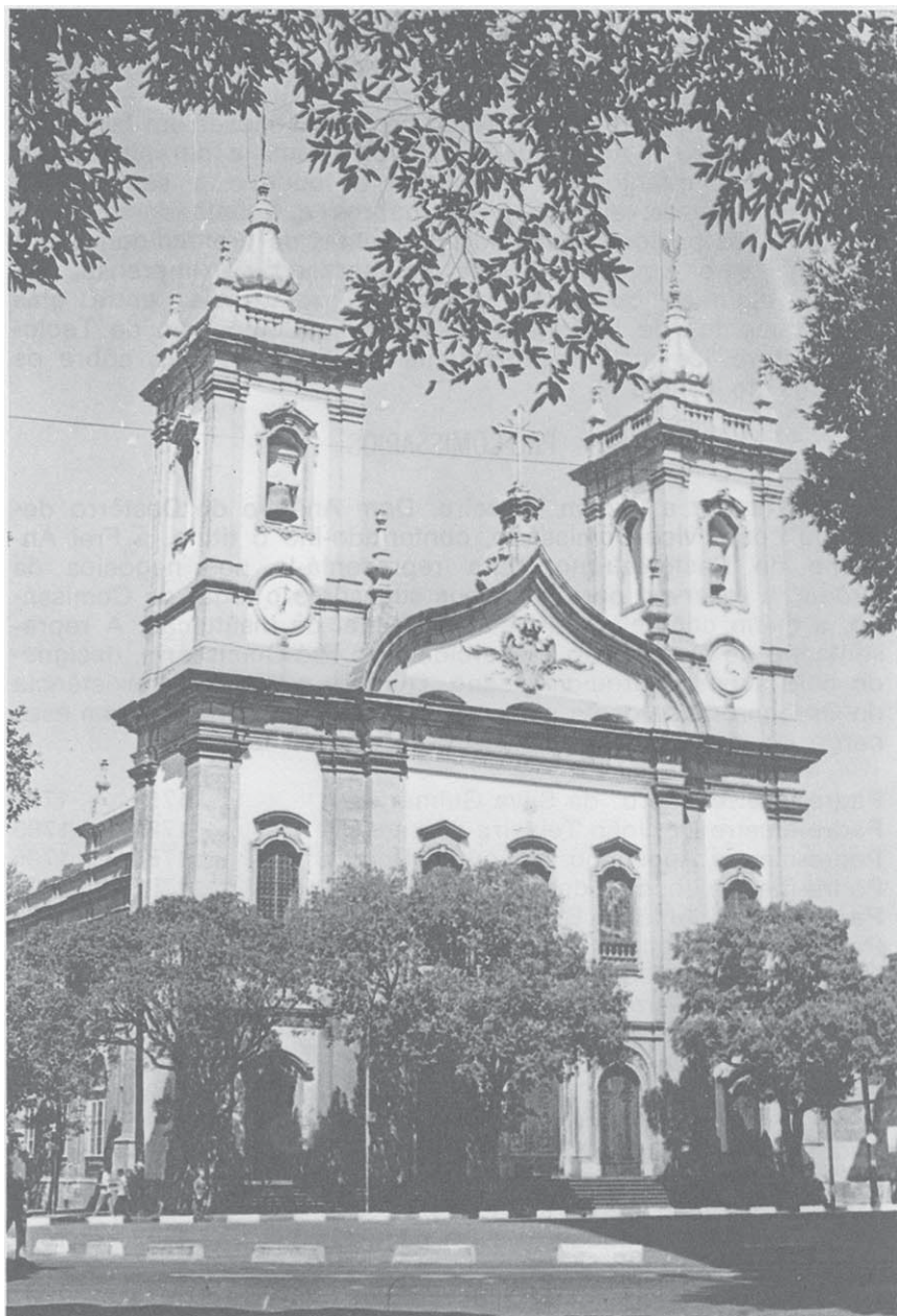
Fachada do templo de São Francisco de Paula